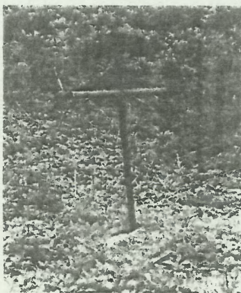
Symboliczny krzyż na miejscu egzekucji rodziny żydowskiej w Ponicach